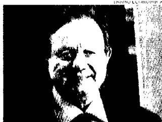
Il Ministro. Altero Matteoli è nato a Cecina (Livorno) l'8 settembre 1940

Entro il 2012 saranno completati i lavori sulla Salerno-Reggio Calabria