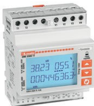
Esempio contatore di energia

Per il monitoraggio dell'impianto di climatizzazione a pompa di calore sarà installato un contatore di energia dedicato per la misurazione dell'energia attiva utilizzata. Attraverso l'integrazione con un convertitore dati, il contatore potrà essere collegato anche alla rete LAN così da poter visualizzare i dati da uno o più computer della rete.