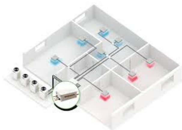
Figura – Esempio impianto a pompa di calore VRF

Per il corretto funzionamento del nuovo impianto di climatizzazione, sia in riscaldamento invernale che in raffrescamento estivo, sarà necessario riqualificare l'impianto di distribuzione esistente con nuove tubazioni coibentate per il trasporto del fluido termovettore (gas) ed evitare problemi di condensa durante la stagione estiva. In tal senso, si prevede la posa delle nuove tubazioni con la realizzazione di tracce eseguite a parete e l'installazione di collettori di zona (piano terra e primo piano). La stima dei costi per la realizzazione del nuovo impianto tiene conto anche delle spese edili complementari e necessarie per la corretta realizzazione dell'opera. La pompa di calore sarà collocata all'esterno, in uno spazio opportunamente recintato per evitare l'interferenza con terzi.