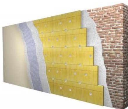
Esempio di applicazione di un cappotto esterno