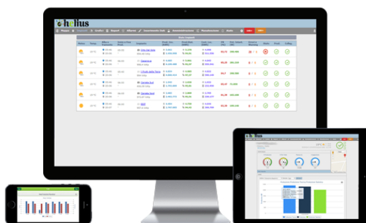
Esempio output sistema di monitoraggio fotovoltaico

Per il monitoraggio dell'impianto di climatizzazione a pompa di calore sarà installato un contatore di energia dedicato per la misurazione dell'energia attiva utilizzata. Attraverso l'integrazione con un convertitore dati, il contatore potrà essere collegato anche alla rete LAN così da poter visualizzare i dati da uno o più computer della rete.