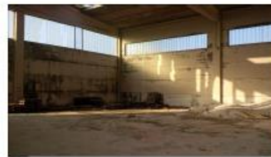
FOTO 11 - Area interna capannone