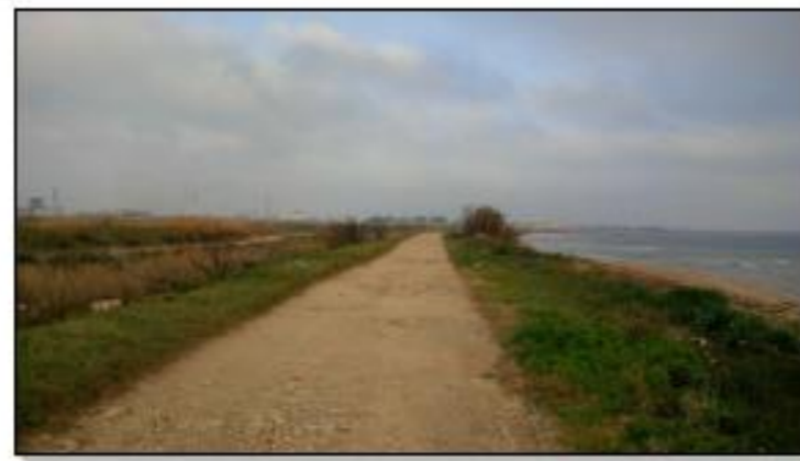
FOTO 2 - Strada lungomare