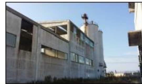
FOTO 9 - Area esterna capannone