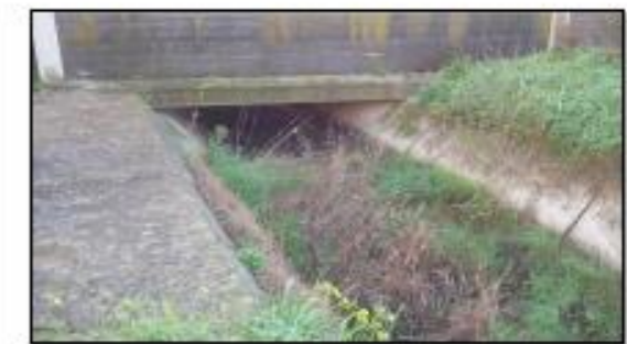
FOTO 12 - Canale Pandi