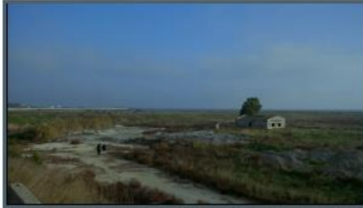
FOTO 6 - Area adiacente ai capannoni