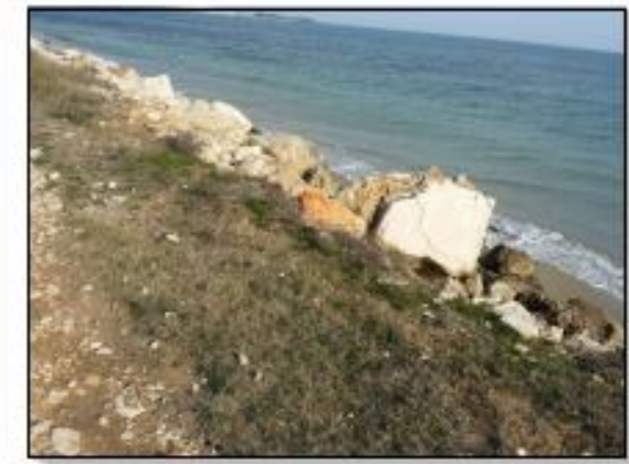
FOTO 4 - Scogliera di protezione