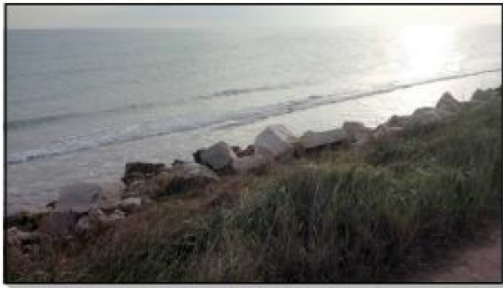
FOTO 5 - Strada lungomare e scogliera di protezione